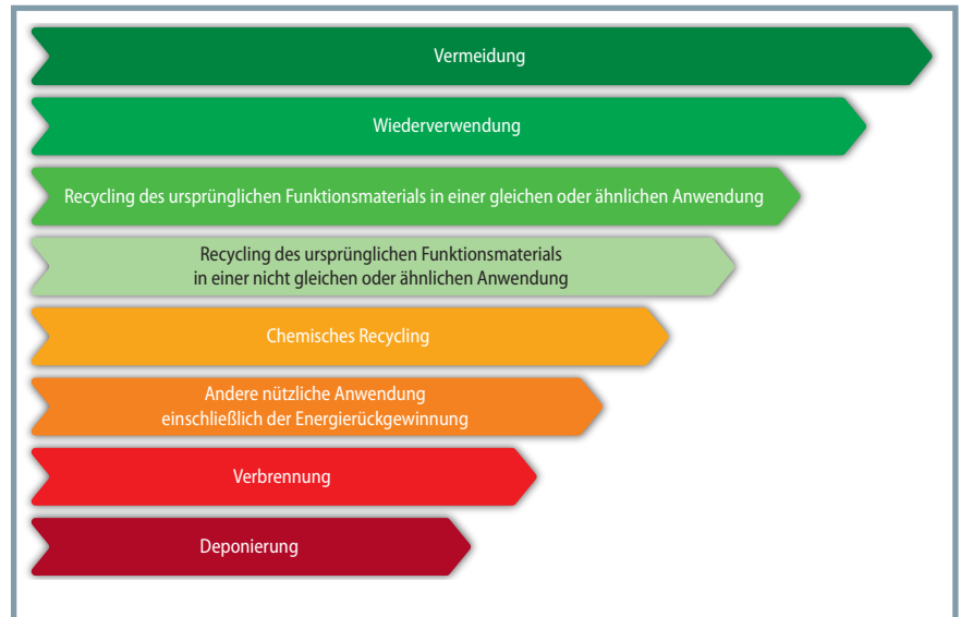
Bild 1. Modifizierte 8-stufige Abfallhierarchie nach DEFRA 2011 [13] Quelle: Fraunhofer IVV, Grafik: © Hanser

Im Gegensatz dazu ändern chemische Recyclingverfahren immer das polymere Grundgerüst des Kunststoffs und produzieren Rohstoffe, aus denen im Zuge weiterer chemischer Prozesse wieder Kunststoffe herstellbar sind ( Titelbild ). Depolymerisationsverfahren zerlegen Polymere in ihre Monomere, die dann nach Reinigung wieder in den Polymerisationsprozess zurückgeführt werden können. Thermolytische Verfahren hingegen erzeugen Öle und Gase, aus denen wich-